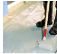
9 Eine zweite Schicht Triflex ProTerra wird aufgebracht.