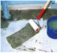
1 Wandanschluss und Fläche grundieren.