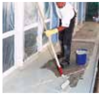
7 Auf die Fläche wird Triflex ProTerra satt vorgelegt.