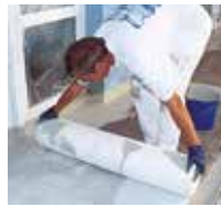
8 Das Triflex Spezialvlies wird vollflächig und blasenfrei eingearbeitet.