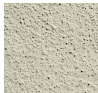
7032 Kieselgrau Einstreuung