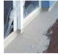
5 Eine zweite Schicht Triflex ProDetail wird aufgebracht.