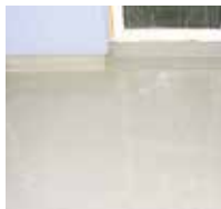
12 Fertig. Danach folgt der Fremdbelag.