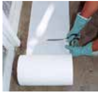
2 Triflex Spezialvlies-zuschnitte vorbereiten.