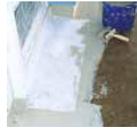
4 Das Triflex Spezialvlies wird vollflächig und blasenfrei eingearbeitet.