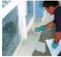
3 Zuerst werden die Details mit Triflex ProDetail abgedichtet.