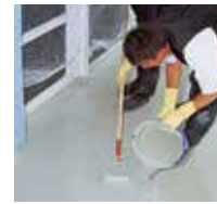
10 Die Nutzschrift Triflex ProTerra wird auf Details und Fläche aufgebracht.