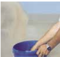
11 Für feste Fremdbeläge wird die Nutzschrift mit Quarzsand abgestreut.