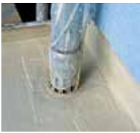
6 Die Details sind sicher abgedichtet.