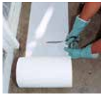
2 Triflex Spezialvlies-zuschnitte vorbereiten.