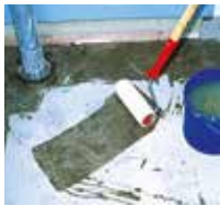
1 Wandanschluss und Fläche grundieren.