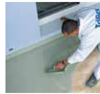
11 ... mit einer Kelle aufziehen und egalisieren.