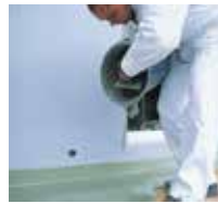
10 Die Nuttschicht: Triflex ProFloor ...