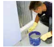
12 Die Versiegelung Triflex Cryl Finish 205 auftragen und ...