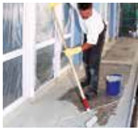
7 Auf die Fläche wird Triflex ProTerra satt vorgelegt.