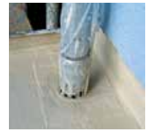
6 Die Details sind sicher abgedichtet.