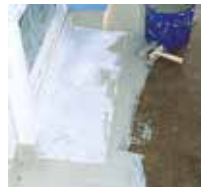
4 Das Triflex Spezialvlies wird vollflächig und blasenfrei eingearbeitet.