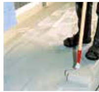
9 Eine zweite Schicht Triflex ProTerra wird aufgebracht.