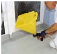
13 ... Triflex Micro Chips einblasen.