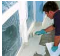
3 Zuerst werden die Details mit Triflex ProDetail abgedichtet.