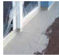
5 Eine zweite Schicht Triflex ProDetail wird aufgebracht.