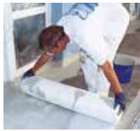
8 Das Triflex Spezialvlies wird vollflächig und blasenfrei eingearbeitet.