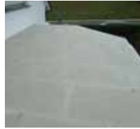
9 ... auf der Fläche verkleben. Es folgt die Grundierung mit Triflex Cryl Primer 276.