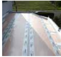
3 ... Fläche mit Randstreifen abgrenzen.