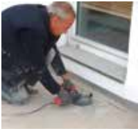
1 Untergrund vorbehandeln, z.B. durch Schleifen oder Fräsen.