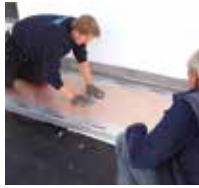
2 Dampfsperre aufbringen und ...