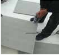
7 Die Zementplatten zuschneiden, ...