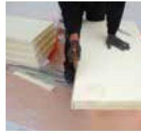
4 Wärmedämmplatten zuschneiden ...