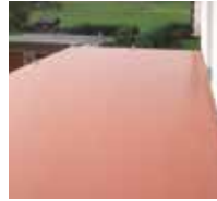
10 Im Anschluss wird das Abdichtungssystem Triflex BTS-P aufgebracht.