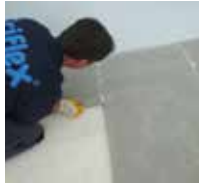
8 mit Flachdübeln zusammenfügen und ...