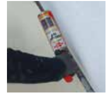
6 Ränder und Nähte ausspritzen.