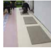
5 ... und auf der Fläche verkleben.